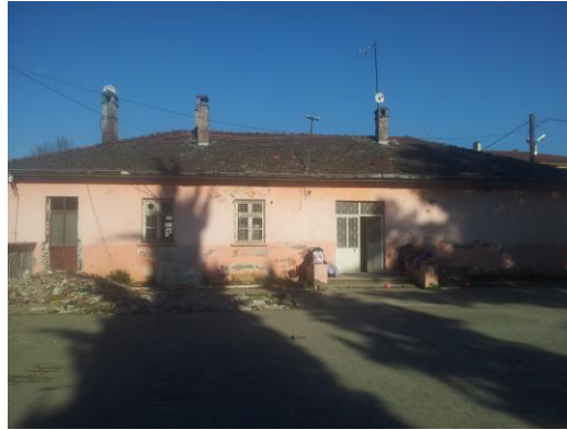
Dikbıyık İlkokulu (1954-1994)