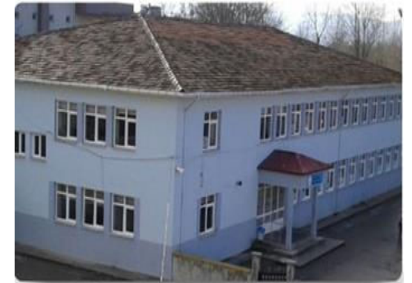
Dikbıyık İlköğretim Okulu (1994-2004)