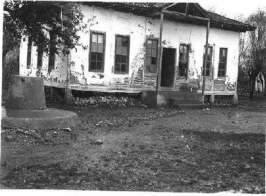
Çarşamba Dikbıyık Köyü okulu. s:97

Okulumuz ilk öğrencimiz 1925 yılında kayıt olmuştur Kazım Efendi adındaki bu ilk öğrencimiz üç yıl öğrenim gördükten sonra mezun olmuştur. Okulumuz o zamanlar şimdiki Samsun-Trabzon yolu üzerindeki ahşap bina olarak hizmete başlamıştır.1954 yılında ise şuan okul bahçemizde atıl durumda olan binada İlkokul olarak hizmet vermeye başlamıştır.1975 yılında şuan ki binamızın olduğu yerde bulunan ortaokul açılmış ve mezun öğrencilerimiz ortaokul kısmını burada tamamlamışlardır. 1994 yılında öğrenci sayımızdaki artıştan dolayı şuan ortaokul binası olarak hizmet veren iki katlı bina yapılmış ve 1997 yılında zorunlu eğitime geçildikten sonra sekiz yıllık ilköğretim Okulu olarak hizmete başlamıştır. Taşıma merkezi yapılan okulumuz ikili öğretim olarak devam ederken ihtiyaçtan dolayı 2004 yılında şuan kullandığımız üç katlı binamız yapılmıştır.2012-2013 eğitim-öğretim yılında ise kesintili eğitim sisteminin başlamasından dolayı bu bina Dikbıyık İlkokulu'na, diğer bina ise Dikbıyık Ortaokulu'na tahsis edilmiştir.